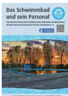
Titelbild: Freibad Derne, Foto: Marco Hartz