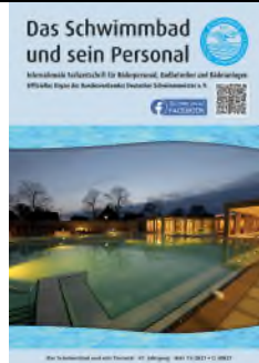
Titelbild/Foto: Solebad Werne